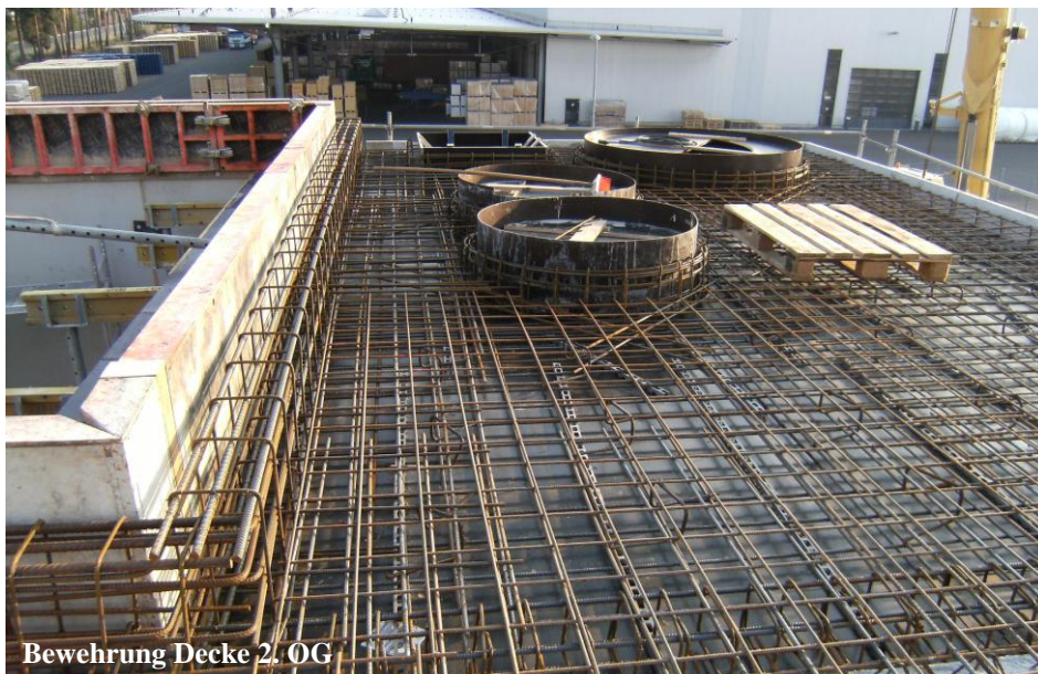
Bewehrung Decke 2. OG